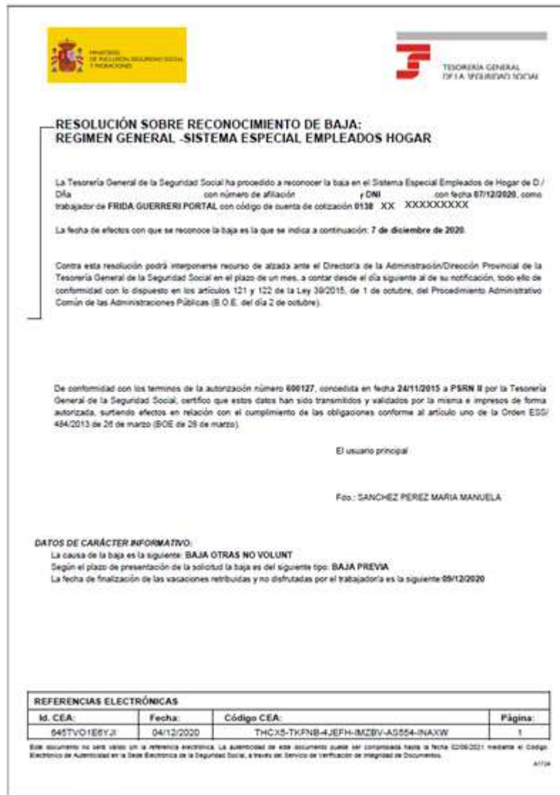
Ejemplo de resolución de baja