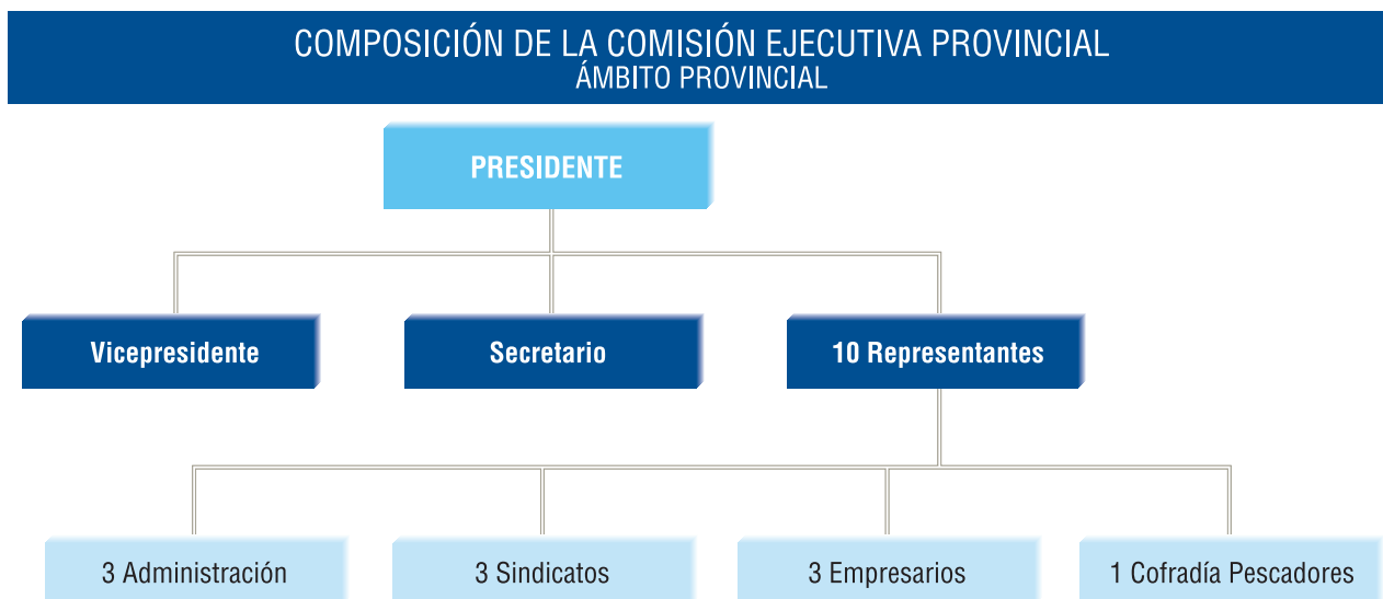
Cuadro nº 5

Comisión Ejecutiva Provincial, compuesta de un Presidente, un Vicepresidente, un Secretario, tres representantes de la Administración del Estado, tres de los Sindicatos, tres de las Organizaciones empresariales y uno de las Cofradías de Pescadores.