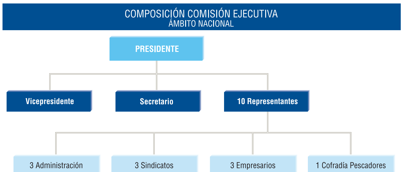
Cuadro nº 4

La Comisión Ejecutiva Central se compone de un Presidente, un Vicepresidente, un Secretario, tres representantes de la Administración del Estado, tres de los Sindicatos, tres de las Organizaciones empresariales y uno de las Cofradías de Pescadores.