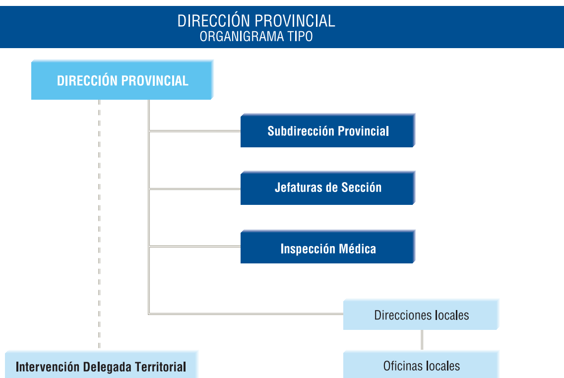
Cuadro nº 2

el traspaso de la asistencia sanitaria a la Comunidad Autónoma correspondiente, y la Intervención Delegada Territorial, que depende funcionalmente de la Intervención General de la Seguridad Social.