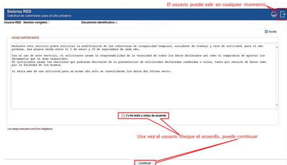
Ilustración 2: Mensaje informativo y aceptación de condiciones.

Situados en la pantalla inicial, se deben leer las condiciones y confirmarlas Domicilio de residencia