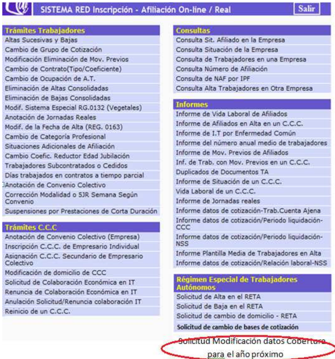
Ilustración 1: Menú principal.