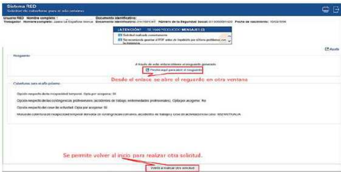
Ilustración 5: Mensaje informativo de solicitud de la modificación.

Para terminar una vez aceptada la solicitud, se regresará a la pantalla inicial del proceso con el correspondiente mensaje: “SOLICITUD REALIZADA CORRECTAMENTE”.