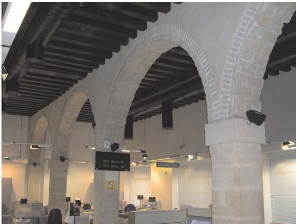
Administración - C/ Ancha, 5 - Jerez de la Frontera - Cádiz

33.121.269,59 euros, fraude descubierto en el ejercicio 2004, cuantificado económicamente.