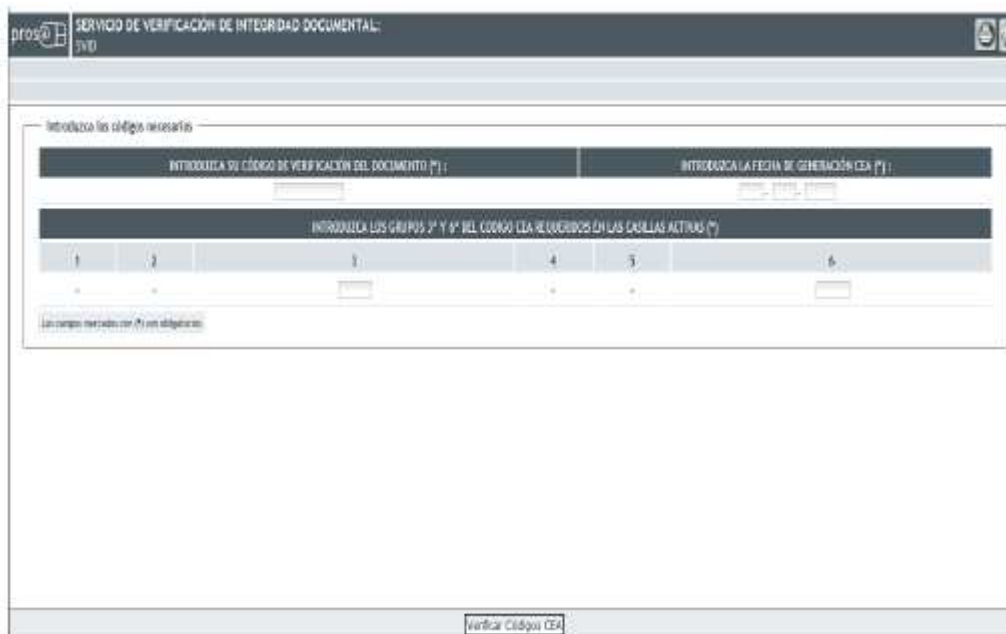
Ilustración 7: Entrada de datos

Cuando se entra en el servicio, se muestra la siguiente pantalla de entrada de datos: