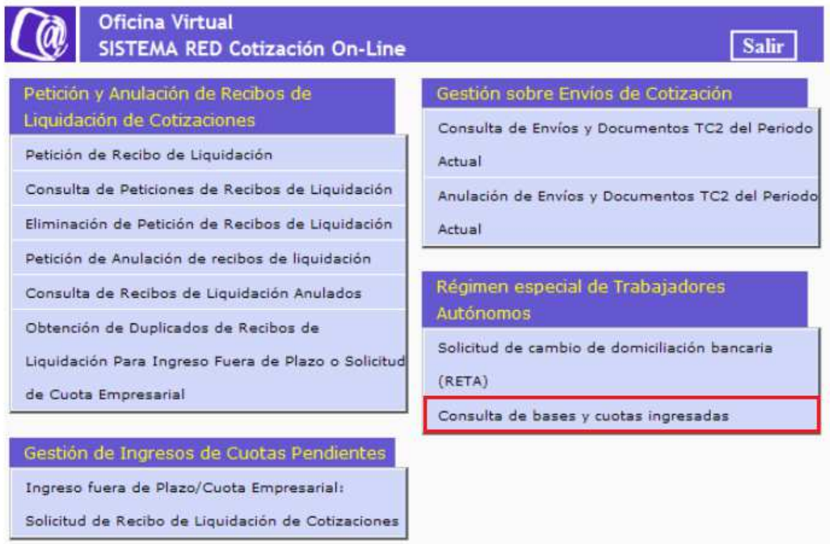
Ilustración 1: Menú

Para RED DIRECTO, se accederá con la selección de la opción: Régimen especial de Trabajadores Autónomos del apartado “Cotización Red Directo” a la siguiente pantalla.