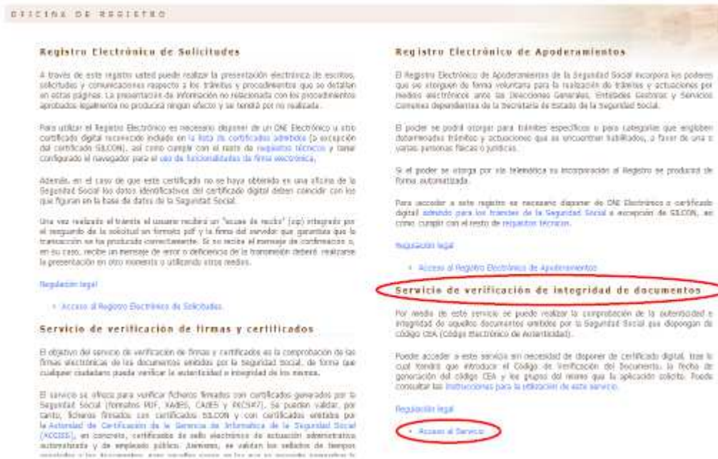
Ilustración 6: Servicio de verificación

Una vez dentro de la Oficina de registro, se debe entrar en el Servicio de verificación de integridad del documento: