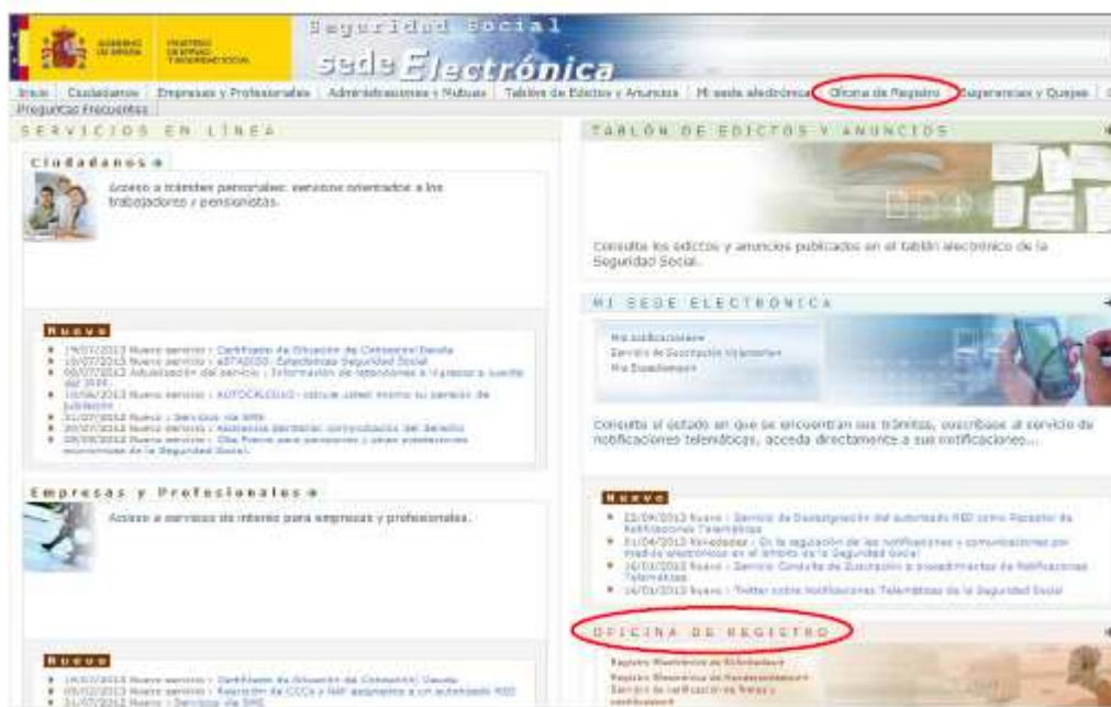
Ilustración 5: Oficina de Registro

Para el acceso no es necesario ningún certificado digital.