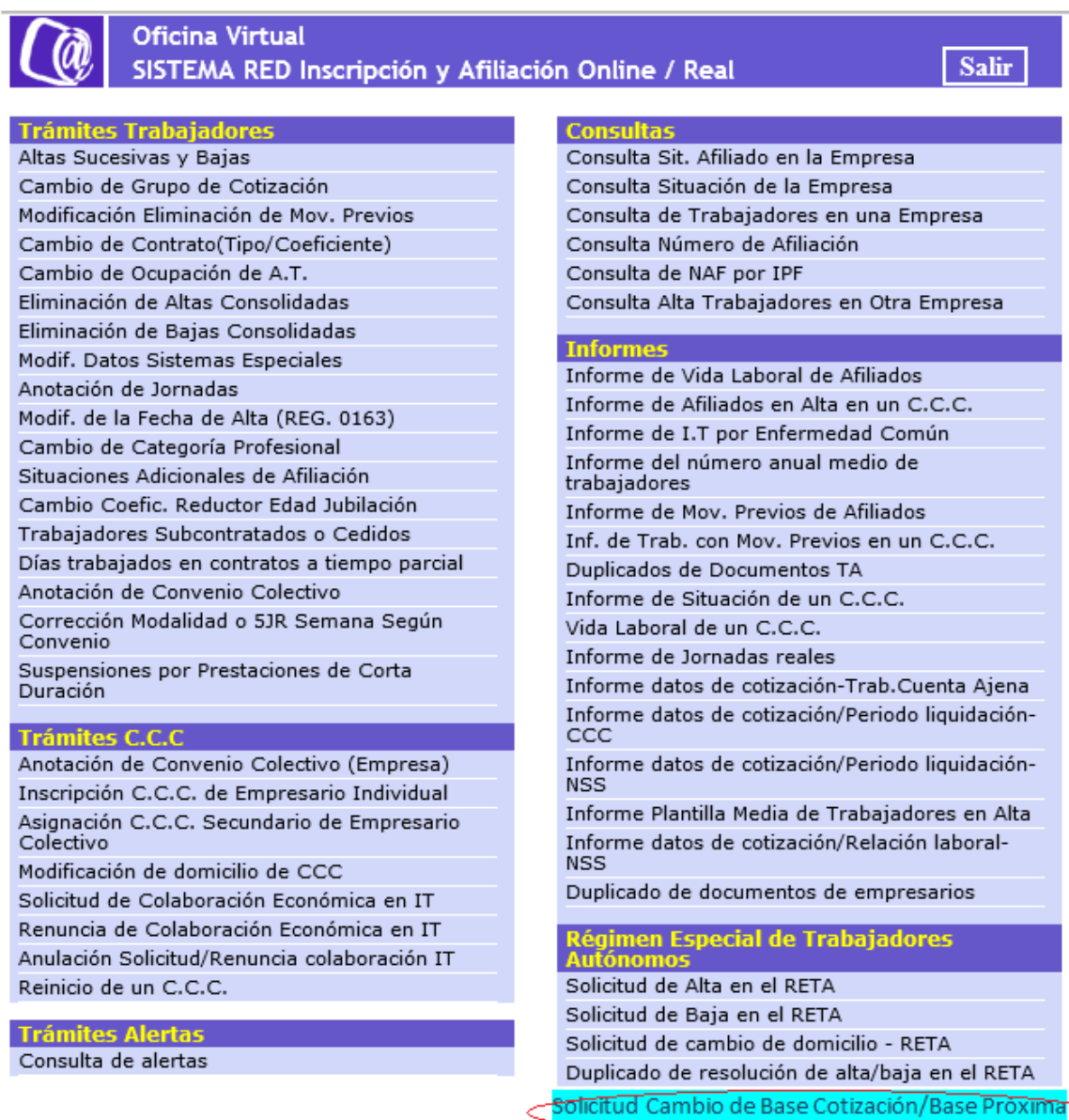
Ilustración 1: Menú de acceso.