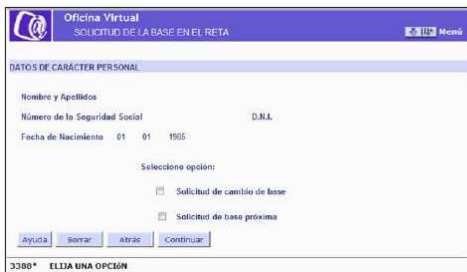
Ilustración 3: Solicitud cambio de base.

Situados en la pantalla inicial, se deben introducir el Número de Seguridad Social y el Documento de Identidad del trabajador Autónomo sobre el que se desea solicitar el cambio de base de cotización, seleccionando previamente en el desplegable la opción DNI o NIE.